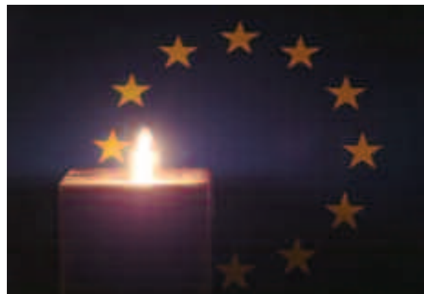
Vela encendida en el Día Internacional de los Derechos Humanos.

La Unión trabaja para mejorar los derechos humanos sirviéndose del diálogo, de consultas regulares y de otras herramientas, incluidas la ayuda al desarrollo y la promoción de la democracia, la formación en el ámbito de los derechos humanos y, en caso necesario, sanciones diplomáticas y económicas. La UE también ayuda a salvaguardar la paz y ayuda a la estabilización en