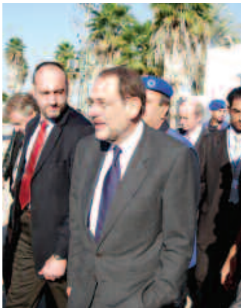
El Alto Representante de la UE, Javier Solana, en el paso fronterizo de Rafah, en la Franja de Gaza, diciembre de 2005.

«En nuestra era mundializada debemos defender la dignidad humana y la libertad frente al miedo y las necesidades. Se trata no sólo de un imperativo moral sino que es algo que también redunda en nuestro propio interés.... Si no ayudamos a que nuestros socios se reformen, acabaremos importando la inestabilidad.»