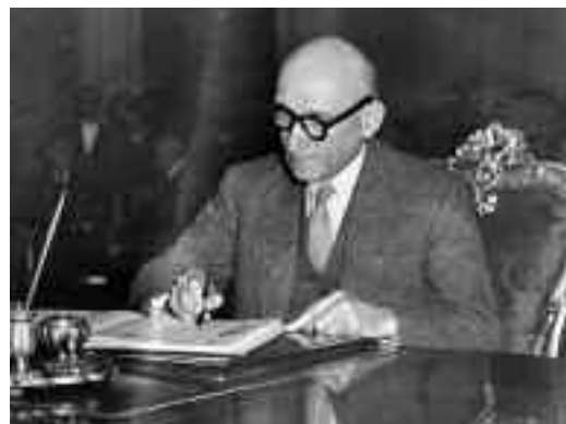
El padre fundador de la UE, Robert Schuman, firma el Convenio Europeo de Derechos Humanos.

Sanciones y medidas restrictivas. Para materializar su oposición a violaciones del Derecho internacional o de los derechos humanos, la UE puede emplear medidas restrictivas y, en algunos casos, sanciones contra países no perteneciente a la UE. Entre ellas se incluyen la suspensión de la cooperación (ayuda) al desarrollo, sanciones comer-