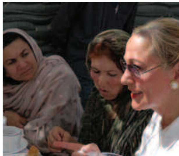
(Izquierda) Niñas en Cisjordania. (Derecha) La Comisaria Europea de Relaciones Exteriores y Política Europea de Vecindad, Benita Ferrero-Waldner, reunida con candidatas a las elecciones afganas de 2005.