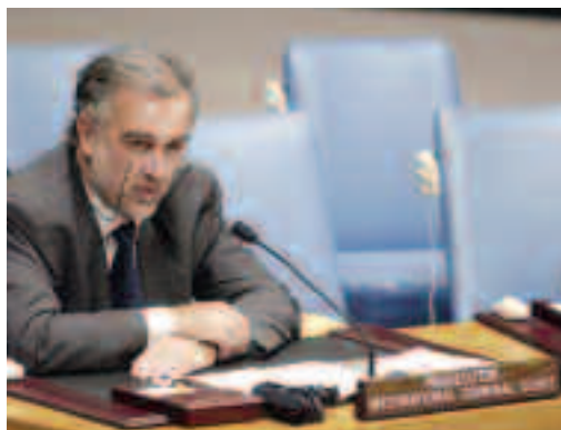
El Fiscal General de la Corte Penal Internacional, Luis Moreno Ocampo.

La UE ejecuta una política de derechos humanos en África basada en la cooperación y no en la confrontación, utilizando medios como el diálogo UE-África, la ayuda política y financiera a los planes sobre gobernanza de la Unión Africana y financiando el mecanismo africano de paz.