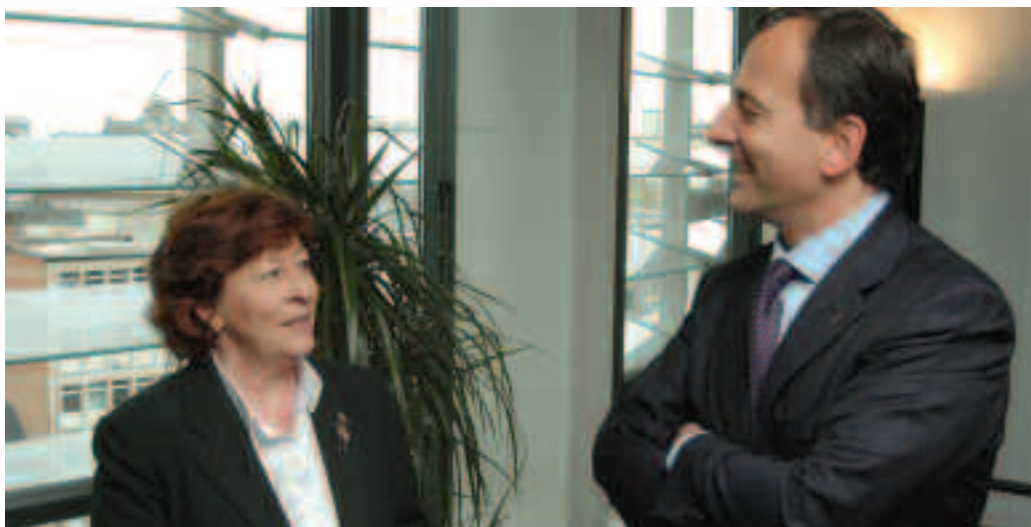
El Comisario Europeo de Justicia, Libertad y Seguridad, Franco Frattini, y Louise Arbour, Alta Representante de la ONU para los Derechos Humanos.

Franco Frattini Vicepresidente de la Comisión Europea y Comisario de Justicia, Libertad y Seguridad 28 de noviembre de 2005